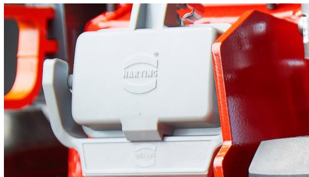
Kombinierter Lade- und Verbindungsstecker