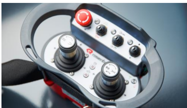
Funksfernbedienung fur Roboter und Werfer