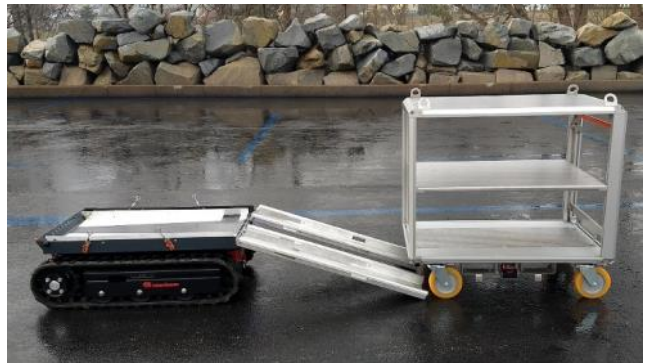
Modul Rollcontainer mit Auffahrtsrampen