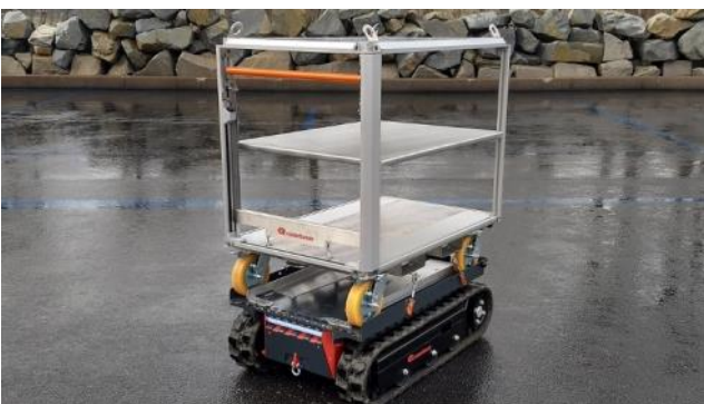
CC81E-A111 - Transport Rollcontainer (Lage hoch)