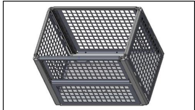
CC81A-A501 - Nutzlastmodul Gitterbox