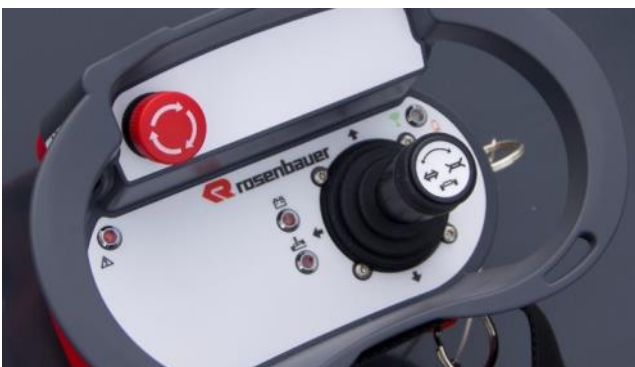
Funkfernbedienung für Roboter