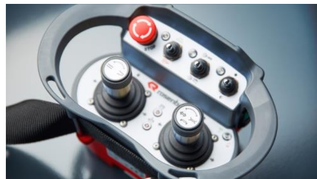
Funkfernbedienung für Roboter und Wasserwerfer