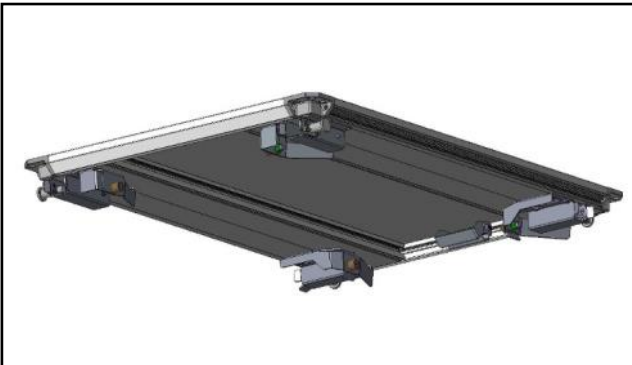
CC81A-A101 - Nutzlastmodul 800 x 1200 mm