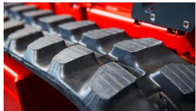
150 mm breite Ketten für ausgezeichnete Traktion