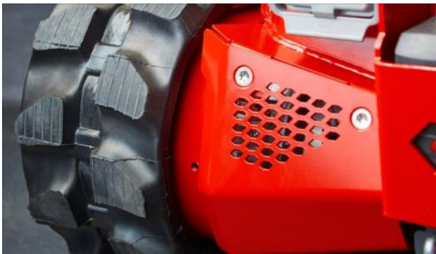
Leistungsstarke 48V Elektroantriebe für die Ketten