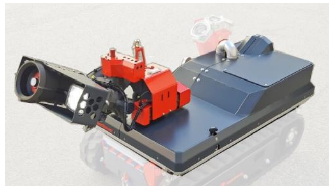
CC81J-A101 - Modul RM35C (bis 3.800 l/min bei 10 bar)