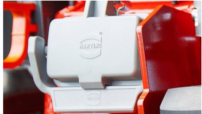
Kombinierter Lade- und Verbindungsstecker