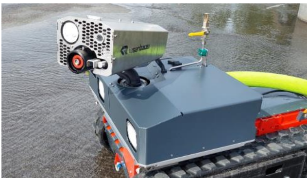
CC81G-A101 - Modul RM15C (bis 2.000 l/min bei 10 bar)