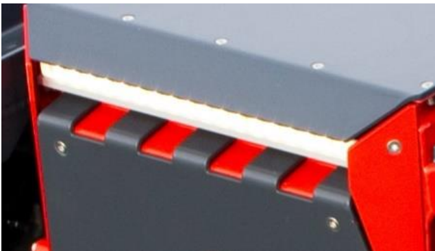
Integriertes LED Fahrlicht an der Front