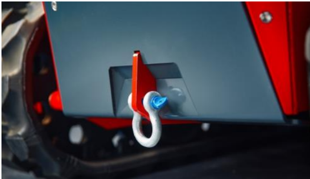
Robuste Front mit Schäkel an der Front