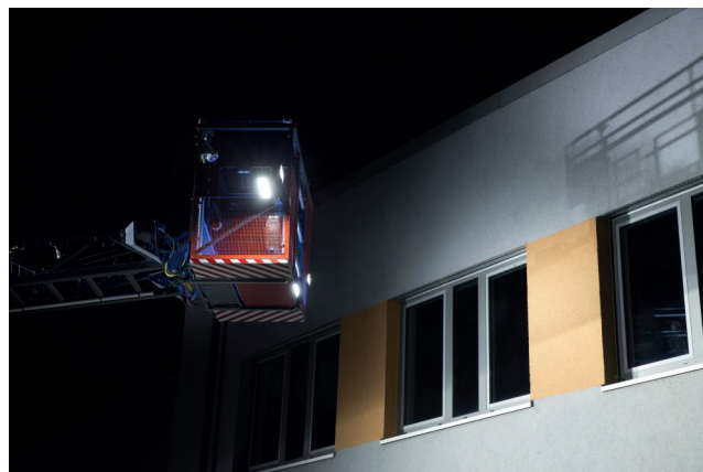
Effiziente LED Beleuchtung